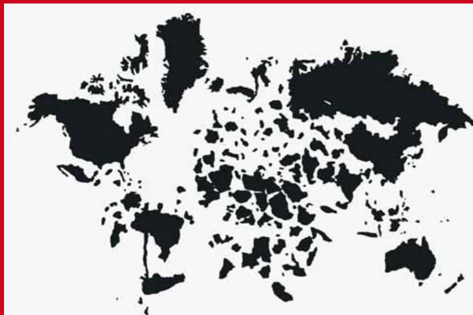
Carlos Amorales. Useless Wonder (Maravilla inútil) , 2006. Videoproyección de dos canales sobre pantalla suspendida, 8' 36" color, sonido, 7' 51" blanco y negro, sin sonido

Colección de Arte Contemporáneo Fundación "la Caixa"