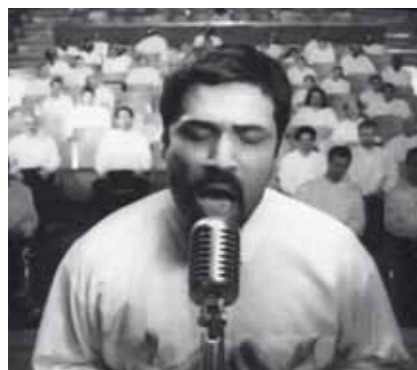
Shirin Neshat. Turbulent , 1998 Videoproyección de dos canales Laserdisc transferido a DVD 10' Blanco y negro, sonido